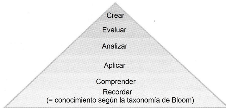
Figura 1 (Fuente: Taxonomía de Bloom B. S. Reflections on the development and use of the taxonomy, 1994.)

Si las actividades áulicas planificadas se basan en :